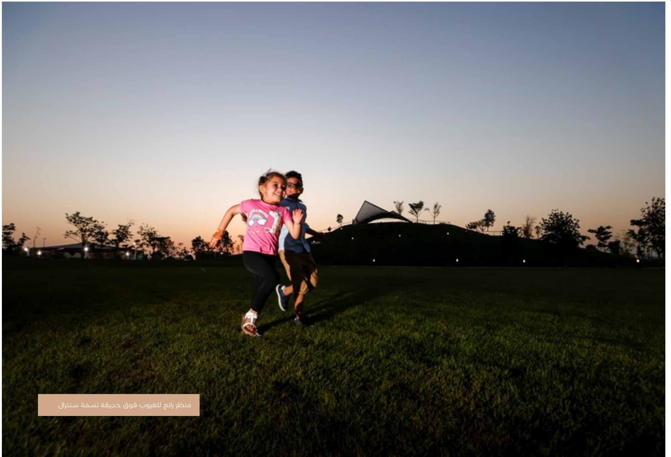
منظر رائع للغروب فوق حديقة نسمة سنترال