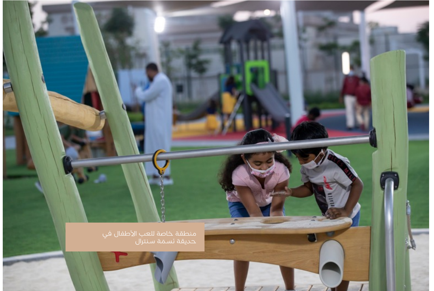
منطقة خاصة للعب الأطفال في حديقة نسمة سنترال