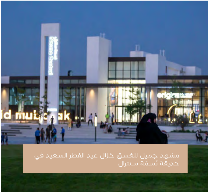
مشهد جميل للغسق خلال عيد الفطر السعيد في حديقة نسمة سنترال