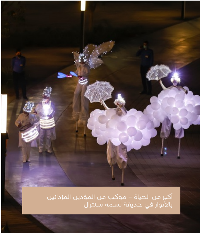
أكبر من الحياة - موكب من المؤدين المزدانين بالأنوار في حديقة نسمة سنترال